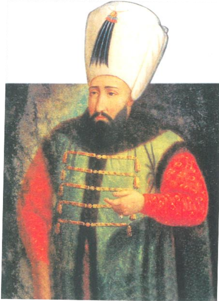
السلطان العثماني إبراهيم الثامن عشر (١٠٢٥هـ-١٠٥٨هـ/١٦١٦م-١٦٤٨م) (٤٢)